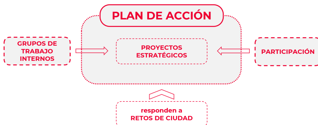
Figura3. Esquema que muestra la formulación del Plan de Acción y por ende, de los Proyectos Estratégicos.

Ya en el marco de la redacción del Plan de Acción, los Grupos de Trabajo identificaron una serie proyectos, planes y/o estrategias con diferentes grados de madurez y orientados a hacer frente a los retos que tiene Dos Hermanas, reconocidos gracias al diagnóstico realizado. Estas aportaciones se organizaron en base a los 10 Objetivos Estratégicos de la Agenda Urbana.