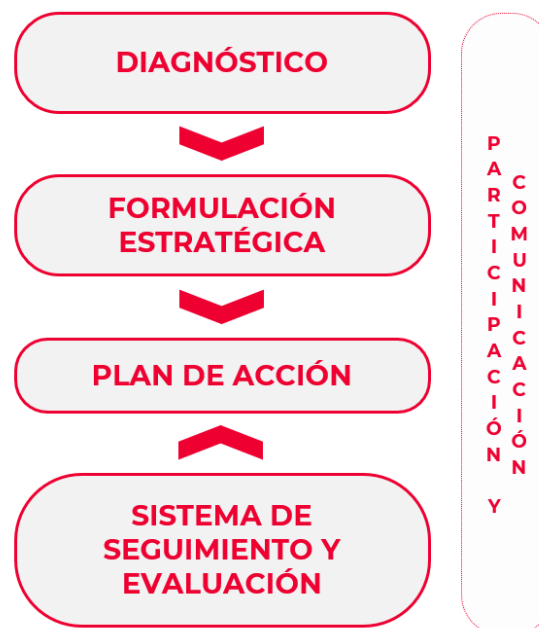
Figura2. Fases de elaboración de la Agenda Urbana de Dos Hermanas