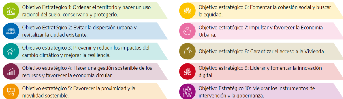
Figura1. Objetivos Estratégicos definidos por la Agenda Urbana Española

España se suma con esta Agenda Urbana al trabajo internacional ya iniciado por todos los Estados miembros del sistema de las Naciones Unidas, en la búsqueda de soluciones para los retos que plantean el aumento de la población urbana, las crisis humanitarias, los procesos de transformación del suelo y de construcción de vivienda, la atracción y el desenvolvimiento de actividades económicas y productivas, las relaciones sociales, la pérdida de identidad cultural y las repercusiones ambientales del cambio climático. Todo ellos son problemas que se abordan desde la triple visión de la sostenibilidad: social, económica y medioambiental , presentes también en el Decálogo de Objetivos Estratégicos que propone esta Agenda.